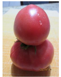
2個つながった だるまトマト